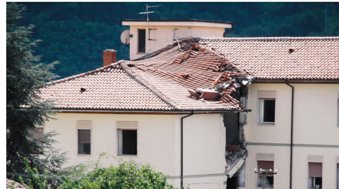
INTERVENTI POST TERREMOTO