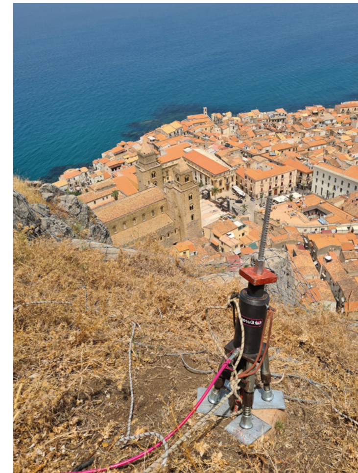
CONSOLIDAMENTO PASSIVO - FERMANEVE