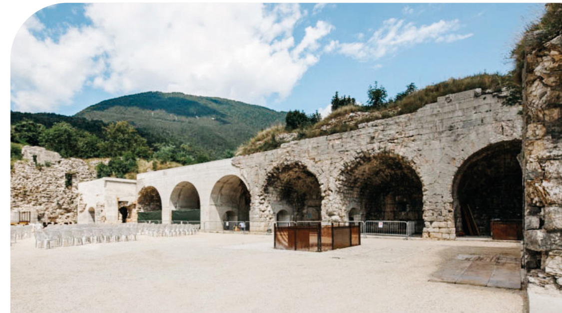
CONSERVAZIONE E MANUTENZIONE DI EDIFICI STORICI