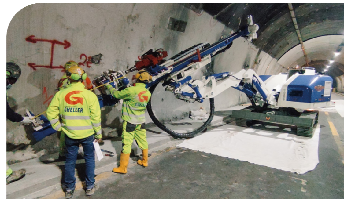
RIPRISTINO E MESSA IN SICUREZZA